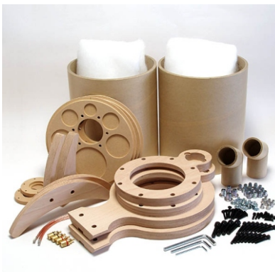
ユニットなしキット 型番CB200-F(ユニットなし)