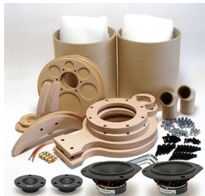
ユニット付キット型番CB200-F(ユニット付) MarkAudio TW-3ツィーターとVifa BC14ウーファー、ネットワーク部品が付属します。(上記写真にネットワーク部品は写っていませんがキットに付属しています)

CB200-Fはツィーターとウーファーを自由に組み合わせて2ウェイシステムの製作が可能なスピーカーキットです。音場感に優れた、伸びやかなサウンドのスピーカーシステムが完成します。